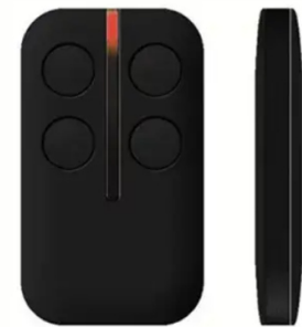
ILUSTRAČNÍ OBRÁZEK- DÁLKOVÝ OVLADAČ